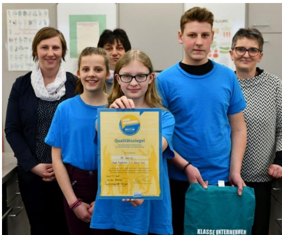
Übergabe des Qualitätssiegel KLASSE Unternehmen für „MC Lessing“ der Regelschule Greiz.