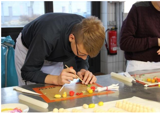
Workshop Konditorei im Bildungszentrum der HWK Erfurt.